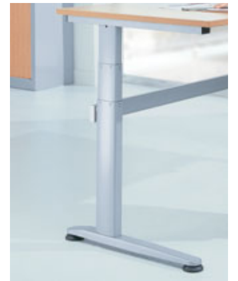
Hoogteregeling tussen 62 en 130 cm