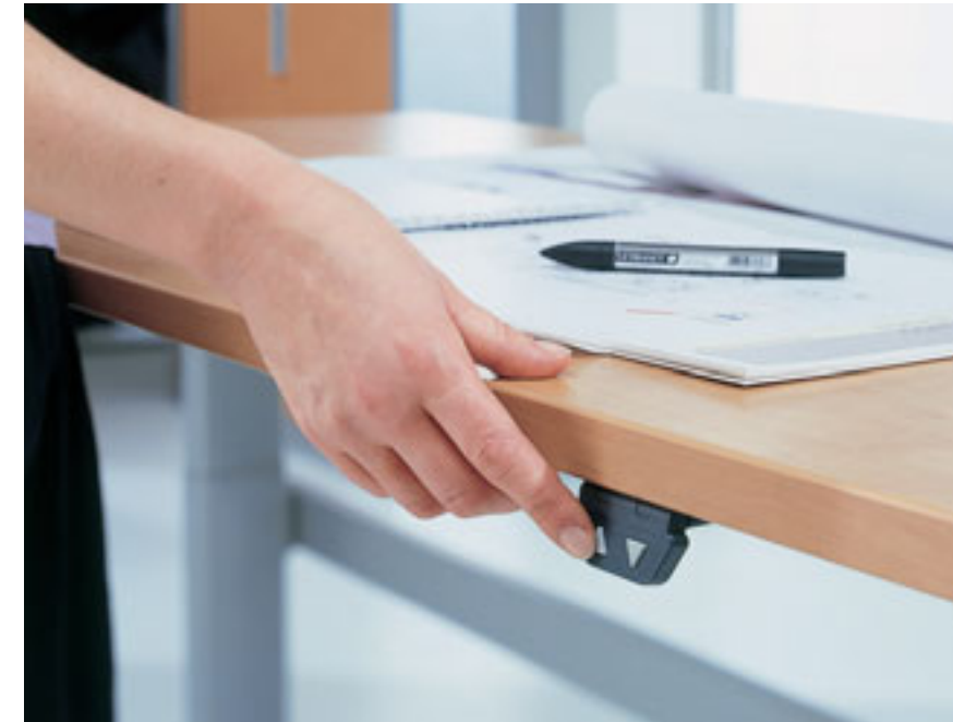
Bedieningsknop onder het blad

De zit-sta tafel is synoniem met maximaal gebruikerscomfort. In nauwelijks 5 seconden wordt ze omgevormd van zittend naar staand gebruik en omgekeerd. Geruisloos en zonder inspanning.