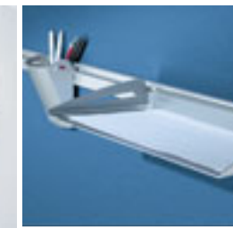
Optionele rail voor accessoires Puebla

Hotline bevat verschillende bladvormen voor opstellingen in serie, parallel of stervormig. Daarmee kunnen call centers gevormd worden met twee tot zes units of meer.