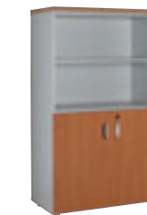
2 deuren + 2 vakken