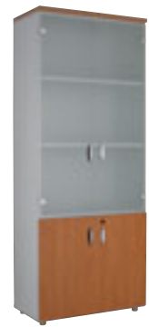
2 deuren + 2 glasdeuren