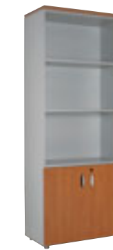
2 deuren + 3 vakken